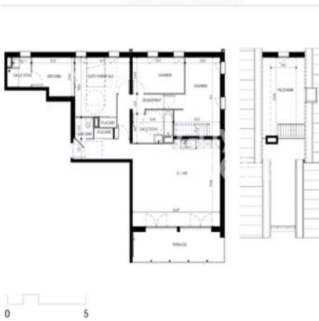
Plan de Pré-commercialisation