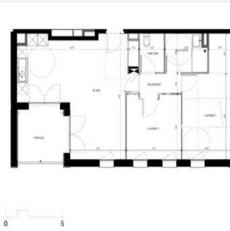
Plan de Pré-commercialisation